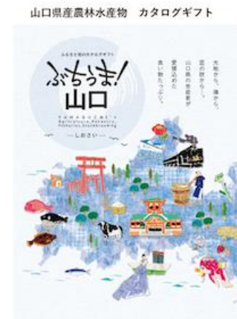
300ポイント カタログギフトから 山口県特産品を1品